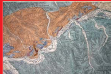
(8) Geologická mapa časti Oravy, 1876.