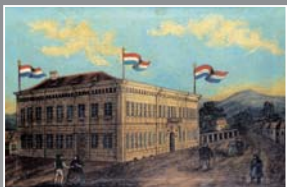
(10) Prvá budova Matice slovenskej v Martine, dobová litografía, okolo 1863.