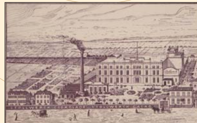
(15) Továrňu na cukrovinky Stollwerck v Bratislave založenú v roku 1896