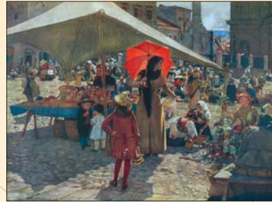
(12) Domínik Skutecký: Trh v Banskej Bystrici, olej, 1890. Krajská galéria v Banskej Bystrici