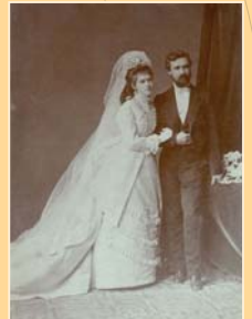
(9) K popredným osobnostiam slovenského národného hnutia koncom 19. - začiatkom 20. storočia patril šéfredaktor Národných novín a spisovateľ Svetozár Hurban Vajanský. Na svadobnej fotografii z roku 1875.