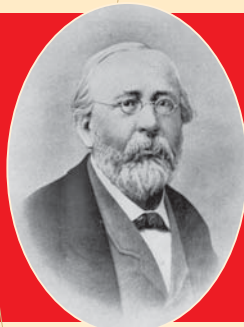
(7) Dionýz Štúr (1827 - 1893), geológ svetového mena, riaditeľ Ríšskeho geologického ústavu vo Viedni, autor veľkého počtu vedeckých prác, aktívny účastník národného hnutia. Za súbor geologických map získal na svetovej výstave v Londýne v roku 1862 zlatú medailu

časťami Uhorska. Zakladané boli najmä podniky železiarskeho, textilného, potravinárskeho, elektrotechnického a chemického priemyslu. Od počiatku 70-tych rokov prebiehala intenzívna výstavba železničných tratí. Novým sociálnym fenoménom v tomto období sa stalo masové vystaňovalectvo do Ameriky.