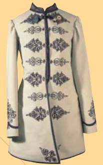
(5) Kabát slovenského národovca - mentieka, 60. roky 19. storočia. SNM - Historické múzeum Bratislava