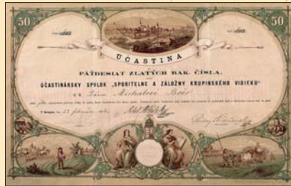
(2) Účastina sporiteľne a záložne v Krupine, 1874