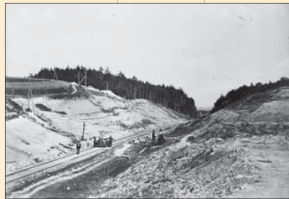
(11) Z výstavby železničnej trate Košice - Bohumín, okolo roku 1870