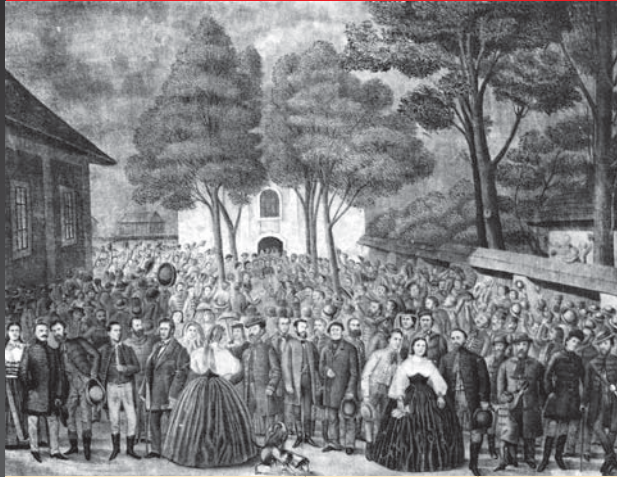
(1) Memorandové zhromaždenie v Martine 6. júna 1861

Po revolúcii 1848 - 1849 sa Rakúsko pretvorilo na absolutistický unitárny štát, v ktorom nebol priestor pre slobodný vývoj. K oživeniu slovenského národného hnutia došlo preto až po zavedení prvkov ústavnosti začiatkom 60-tych rokov. V júni 1861 prijalo veľké zhromaždenie Slovákov v Martine Memorandum, v ktorom žiadali vytvorenie autonómnej oblasti na území obývanom Slovákmi. V roku 1863 bola založená Matica slovenská ako celonárodná kultúrna ustanovizeň. Jej prvým predsedom sa stal katolícky biskup Štefan Moyzes. Po porážke Rakúska vo vojne s Pruskom v roku 1866 panovník František Jozef I. pristúpil na rakúsko-maďarské vyrovnanie, po ktorom sa unitárne Rakúsko zmenilo na dualistické Rakúsko-Uhorsko. Uhorská vláda síce prijala národnostný zákon, za jediný národ však uznávala politicky maďarský národ a v praxi presadzovala maďarizáciu. V roku 1875 zakázala Maticu slovenskú a zhabala jej majetok. Potlačiť rozvoj slovenského národného života a kultúry sa však vládnucim kruhom nepodarilo ani na prelome 19. storočia a 20. storočia, keď maďarizácia dosiahla svoj vrchol. Z hospodárskeho hľadiska patrilo Slovensko aj v tomto období k vyspelejším