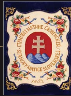
(3) Obal stanov Matice slovenskej, 1863