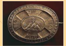
(6) Oznak z osláv 1000. výročia prichodu vierozvestov a zakladateľov slovenského písomníctva sv. Cyrila a sv. Metoda na Veľkú Moravu, 1863

časťami Uhorska. Zakladané boli najmä podniky železiarskeho, textilného, potravinárskeho, elektrotechnického a chemického priemyslu. Od počiatku 70-tych rokov prebiehala intenzívna výstavba železničných tratí. Novým sociálnym fenoménom v tomto období sa stalo masové vystaňovalectvo do Ameriky.