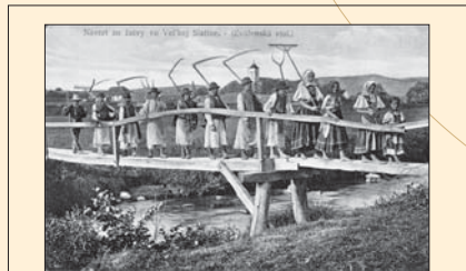
(14) P. Socháň: Návrat zo žatvy vo Zvolenskej Slatine, dobová fotografia, okolo roku 1900