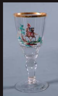
(16) Slávený pohár s jazdcom, koniec 18. storočia. SNM - Historické múzeum Bratislava