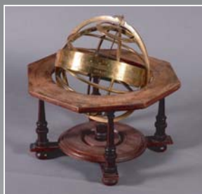
(12) Mosadzný glóbus z evanjelického lýcea v Bratislave, 1802. SNM - Historické múzeum Bratislava