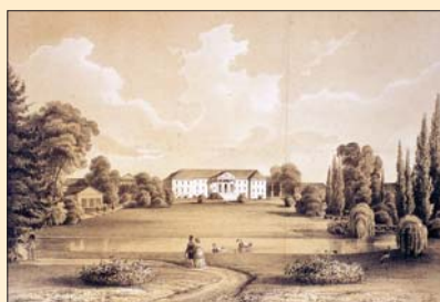
(11) Kaštieľ v Dolnej Krupovej, sídlo rodiny Brunšvikovcov. Litografia, začiatok 19. storočia. Podľa tradície tu Ludwig van Beethoven skomponoval skladbu Sonáta mesačného svitu