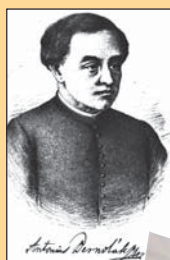
(3) Anton Bernolák (1762 - 1813) Nové Zámky), katolícky kňaz, jazykovedec, organizátor Slovenského učeného tovaríšstva v Trnave, prvý kodifikátor slovenčiny