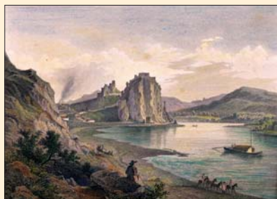
(13) Hrad Devín, litografia, polovica 19. storočia. Roku 1809 ho napoleonské vojská vyhodili do povetria