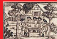
(9) Učiteľka poučuje sedliakov