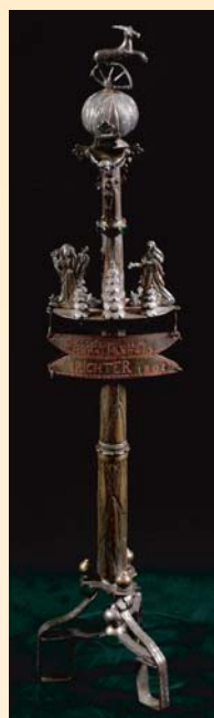
(14) Palica richtára z Kiripolca, 1803. SNM - Historické múzeum Bratislava