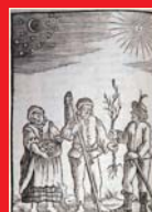
(7) Sadenie stromčeka