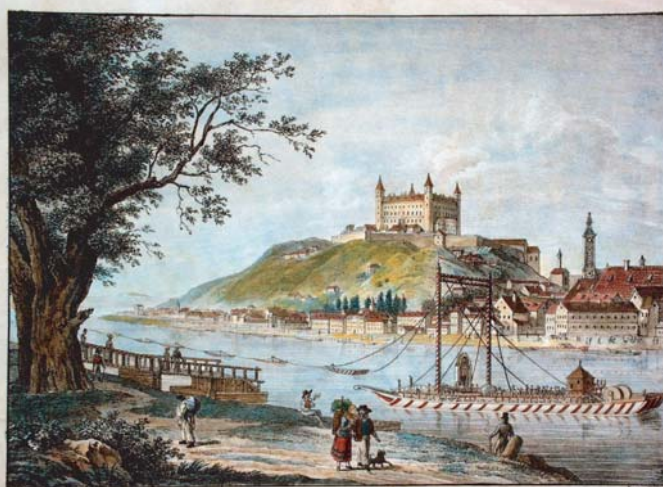
UNGERN Zwit Ansicht von Pestburg

Ovzdušie osvietenstva v druhej polovici 18. storočia malo priaznivý vplyv aj na vývin slovenskej národnosti. Práve v tomto období začal proces národného obrodzenia a formovania Slovákov ako moderného novodobého národa. Významným momentom tohto procesu sa stal prvý pokus o kodifikáciu spisovného slovenského jazyka. Zaslúžil sa oň mladý katolícky kňaz Anton Bernolák jazykovednými dielami vydanými v rokoch 1787 - 1791. Vytvoril ho na báze západoslovenského nárečia a nazýval sa podľa jeho mena „ber noláčtina“. K šíreniu „ber noláčtiny“ a posilňovaniu národného uvedomenia významne prispel spolok Slovenské učené tovaríšstvo založený katolíckymi vzdelancami v Trnave v roku 1792. Slovenskí evanjelici však ako literárny a liturgický jazyk naďalej používali biblickú češtinu. Centrom národného hnutia evanjelikov sa stala Katedra reči a literatúry československej na evanjelickom lýceu v Bratislave zriadená v roku 1803. Obidva jazykové tábory Slovákov museli od začiatku 90-tych rokov 18. storočia čeliť silným maďarizačným tlakom šľachty, ktorá presadzovala zavedenie maďarčiny ako úradného jazyka namiesto tradičnej latinčiny. Vývoj na prelome 18. a 19. storočia ovplyvnila revolúcia vo Francúzsku a napoleonské vojny, ktoré čiastočne zasiahli aj územie Slovenska.