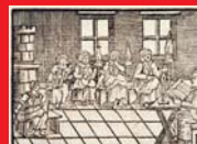
(10) Učiteľka prednáša ženám pri priadkach