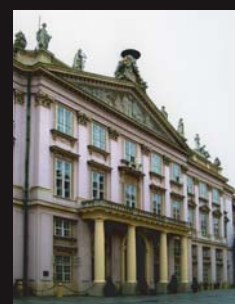
(17) Klasicistický Primaciálny palác v Bratislave, 26. decembra 1805, po bitke pri Slavkove, bol v ňom podpísaný Bratislavský mier