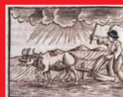
(8) Orba s volmi