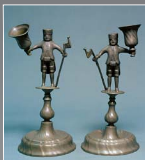
(8) Svetelníky s postavami baníkov, cín, 1705. Slovenské banské múzeum Banská Štiavnica