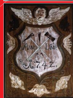
(13) Banský znak na empore evanjelického kostola v Štítrniku, 1742