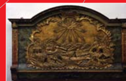
(12) Operadlo kostolnej lavice z Gelnice s banským výjavom, 2. pol. 18. storočia. Banicke múzeum Rožňava