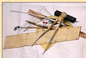
(2) Parergón z banskej mapy Smolníka, Švedlára a Štösu s meračskými a rysovacími pomôckami, 1763