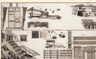
(11) Plány zariadení na úpravu rudy, 2. polovica 18. storočia