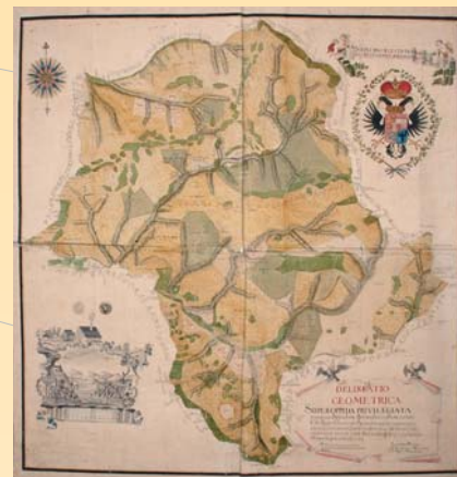
(3) Mapa chotárov banských miest Smolníka, Švedlára a Štösu, 1763. Štátny ústredný banský archív Banská Štiavnica