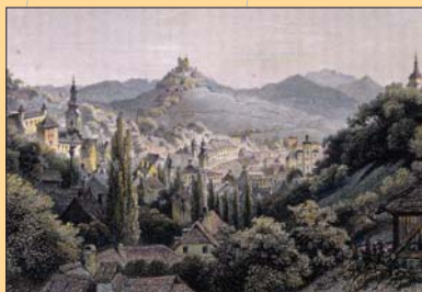
(5) Banská Štiavnica sídlo Banskej akadémie, kolorovaná rytina, polovica 19. storočia