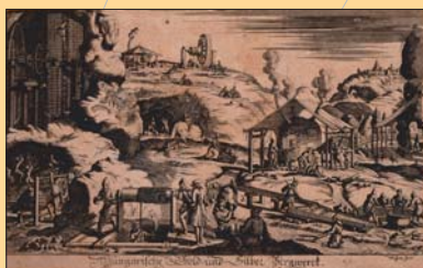
(4) Uhorské bane na zlato a striebro, rytina, 17. storočie