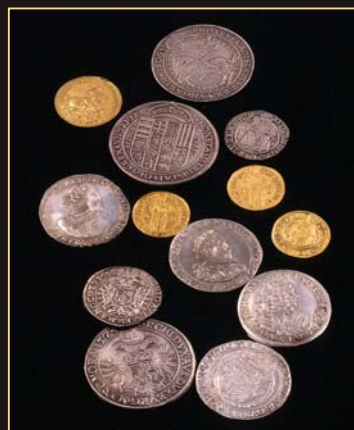
(6) Mince z kremnickej mincovne založenej v roku 1328