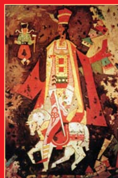
(6) E. Fulla: Jánošík na koni, olej, 1963. Slovenská národná galéria Bratislava