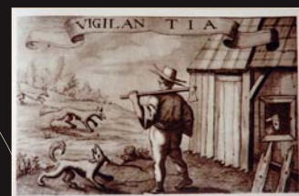
(10) Dača, drevoryt J. Hiebnera, 1662