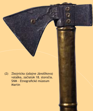
(2) Zbojnička (údajne Jánošíkova) valaška, začiatok 18. storočia. SNM - Etnografické múzeum Martin