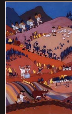
(13) M. Štróvnas: Pandúri a hŕní chlapi, malba na skle, 1977. SNM - Historické múzeum Bratislava