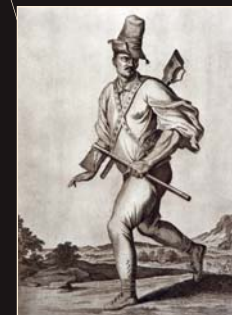
(11) Gorál, rytina C. Weigela, 1703