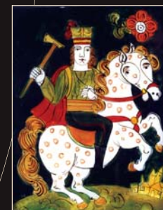
(12) V. Benáčeková: Jánošík na koni, podmalba na skle, 80. roky 20. storočia. SNM - Historické múzeum Bratislava