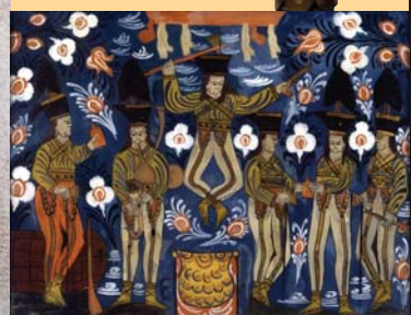
(3) Jánošíkova družina, podmalba na skle, 19. storočie. Západoslovenské múzeum Trnava