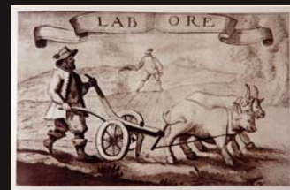
(9) Orba a siatie, drevoryt J. Hiebnera, 1662