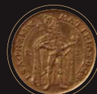
(9) Dvojdukát kráľa Mateja II., averz, reverz, 1614. SNM - Historické múzeum Bratislava