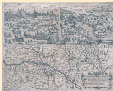
(4) Mapa Uhorska z doby povstania G. Bethlena so zobrazením dobytia Bratislavy cisárskymi vojskami v roku 1621 a obliehania pevnosti Nové Zámky, 1. polovica 17. storočia.