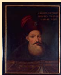
(3) Gabriel Bethlen, sedmohradské knieža, ochrana protestantov, vodca protihabsburgského povstania v rokoch 1619 - 1626, dobový portrét