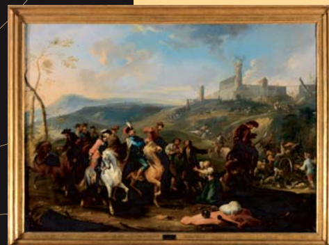
(17) A. Querfurt: Pienenie, olej, začiatok 18. storočia. SNM - Historické múzeum Bratislava