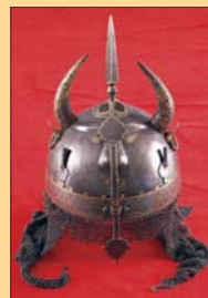
(15) Turecká prítrica kulah khud, 17. storočie. SNM - Historické múzeum Bratislava