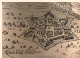
(8) Oslobodenie pevnosti Nové Zámky od Turkov v roku 1685, dobová rytina na medenej platni. SNM - Historické múzeum Bratislava