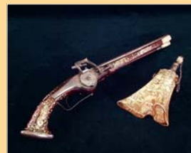
(13) Pištoľ a prachovnica, 17. storočie. SNM - Historické múzeum Bratislava