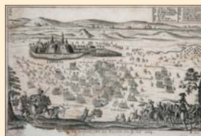
(6) Porážka tureckých vojsk v bitke pri Levíčiach v roku 1664, dobová rytina