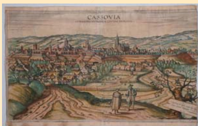
(2) Mesto Košice centrum povstania sedmohradského kniežata Stefana Bočkaja v rokoch 1604 - 1606, kolorovaná rytina J. Hofnagela, 1617