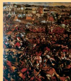
(16) Rozhodujúca porážka Turkov pri Viedni v roku 1683, dobová rytina