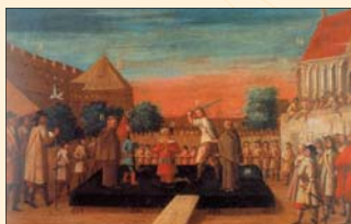
(7) Poprava účastníkov sprisahania uhorskej šľachty proti Habsburgovcom v rokoch 1666 - 1670, dobová olejomalba, 2. polovica 17. storočia