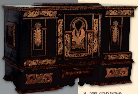
(5) Truhlica, východné Slovensko, koniec 17. storočia