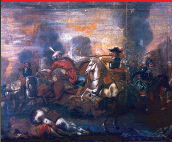
(1) Bojová scéna z protitureckých vojen, olej, 16. storočie. SNM - Múzeum Červený Kameň

V 17. storočí prešlo Slovensko skúškou mnohých ťažkostí, nekludu a útrap. Pokračovalo nebezpečné susedstvo s Osmanskou ríšou, vojenské konflikty a lúpežné nájazdy tureckých útočníkov. Ako víchor sa cez územie Slovenska prehnali štyri povstania uhorskej šľachty namierené proti absolutizmu Habsburgovcov. Náboženské rozbroje vyústili do prenasledovania protestantov a násilnej rekatolizácie. Zhoršené životné podmienky viedli k sociálnym nepokojom a vzburám. Mestá trpeli prítomnosťou šľachty, ktorá sa sem prísťahovala z území obsadených Turkami. Začali sa v nich tiež prejavovať národnostné rozpory medzi Nemcami, Slovákmi a Maďarmi. Aj v týchto zložitých podmienkach však pokračoval civilizačný rozvoj. V priebehu storočia nastal tiež výrazný posun v sebauvedomovaní Slovákov, čo našlo svoj odraz v kultúre i každodennom živote.