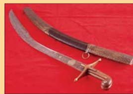
(14) Turecká šabľa kılıč, 17. storočie. Mestské múzeum Bratislava